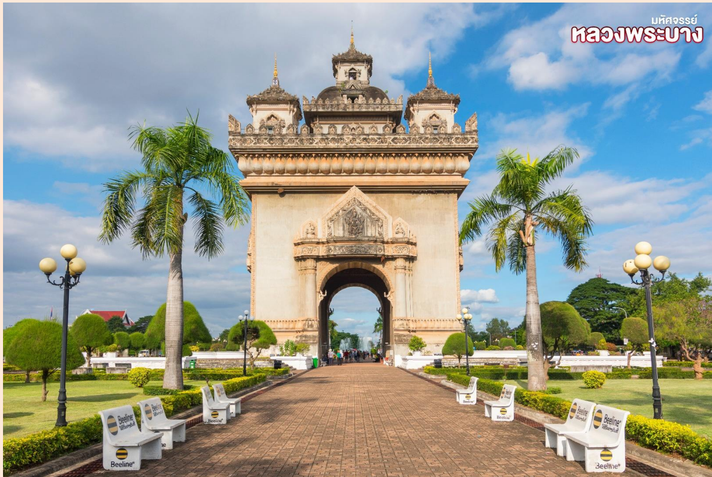
มหัศจรรย์ หลวงพระบาง