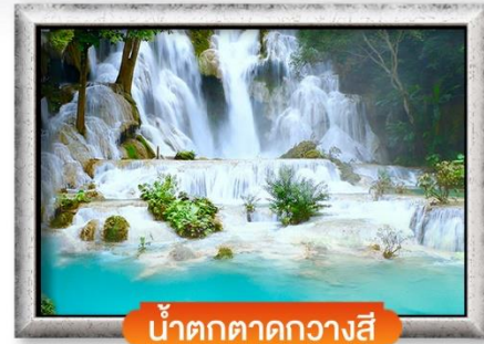
น้ำตกตาดกวางสี