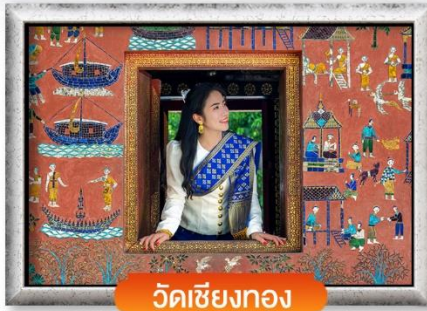
วัดเชียงทอง