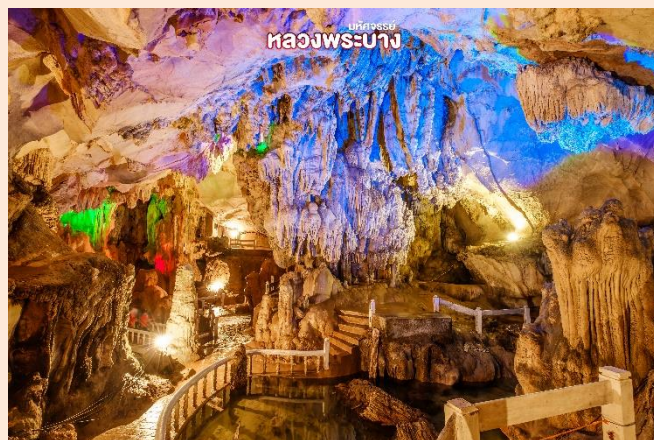
หลวงพระบาง

นำท่านเยี่ยมชม บ้านช่างฆ้อง ศูนย์หัตถกรรม พื้นบ้านอีกแห่งหนึ่งของเมืองหลวงพระบาง ที่รวบรวมสินค้าหัตถกรรมงานฝีมือต่างๆ ไว้ สำหรับนักท่องเที่ยวเข้าเยี่ยมชมหรือเรียนรู้ วิธีการทำ อาทิ การทำงานกระดาษสา การ ทอผ้าไหมของลาว จากนั้นเดินทางสู่ท่าเรือ บ้านช่างไห เพื่อล่องเรือชมวิวทิวทัศน์สอง ฝั่งแม่น้ำโขงสู่ ถ้ำติ่ง ซึ่งเป็นถ้ำอยู่บนหน้าผาริมแม่น้ำโขงมีอยู่ 2 ถ้ำ คือ ถ้ำล่างและถ้ำบน ถ้ำติ่งลุ่ม มีหินงอกหินย้อย มีพระพุทธรูปไม้จำนวนนับ 2,500 องค์ ต่อมาพระเจ้าโพธิสารทรงเลื่อมใส